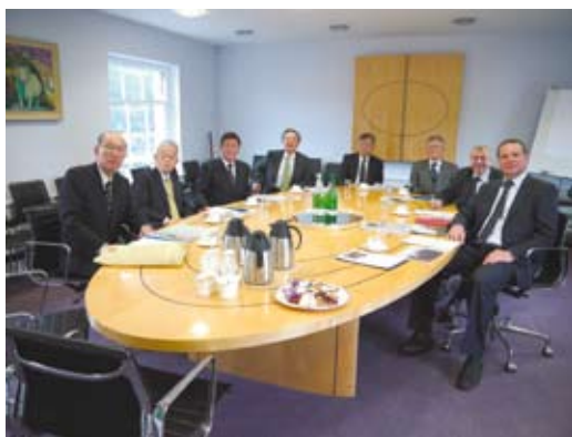
図9 第7回 Review Meeting オックスフォード GTC-Barclay Roomにて。2012年6月