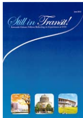
図11 交流プログラム10周年の記念英文冊子 オックスフォードを訪問した学園スタッフの感想をまとめた英語版小冊子(10ページ)は、GTCの広報誌“IN TRANSIT”を念頭に、“Still in Transit!”というタイトルとし、第7回 Review meetingの資料としました。

初めての企画に13名の先生が集まり、それぞれの経験を熱く語られました。座談会を踏まえて、Oxford 滞在を早くレポートしていただきましたので、欠席の先生も含め、派遣順で紹介いたします。なお、レポート英語版は“Still In Transit!”として小冊子(図11)にまとめ、2012年6月22日にOxfordで開催された7th Review Meetingの資料としました。また以下の文章は、レポート