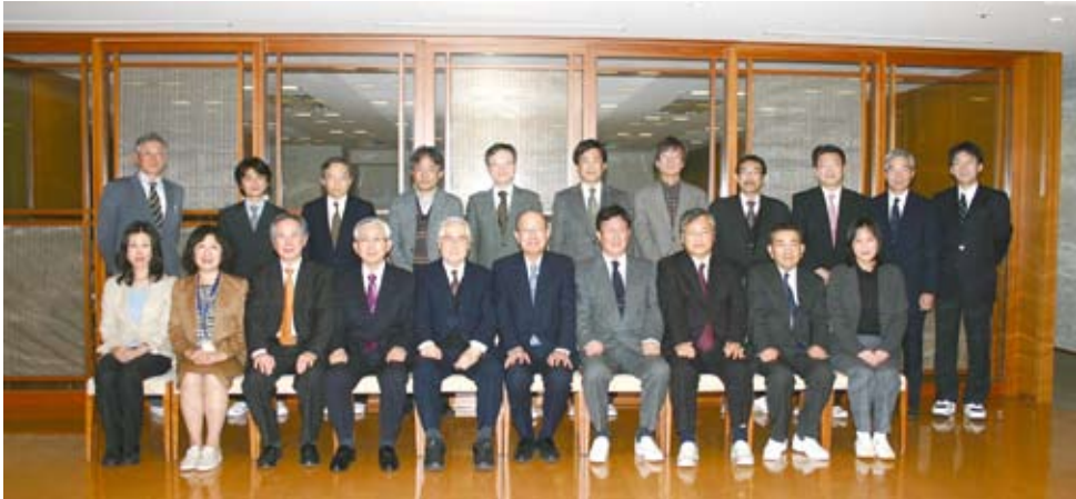
図10 10周年記念座談会の参加者 医大本館8F「楮の木」にて、2012年3月2日

第4回 2008年9月25日(木) Oxford, GC 学長室(図8)GCとTCの合併によってGTC発足。