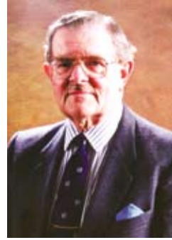
図3 GC 2代目学長 Lord Walton (資料2)より

臨床医学に特化したカレッジをめざす Green カレッジの初代学長 Sir Richard Doll (任期1979～1983) は、タバコ喫煙とヒトの肺癌との関連性を証明した Oxford 大学教授で、高名な疫