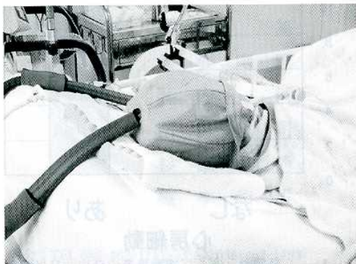
Fig. 2. 局所脳低温療法

近年、脳梗塞重症例に対する脳保護作用を目的とした局所脳低温療法が試みられている。1989年頭部外傷モデルで低体温が強力な脳保護効果を有することが実験的検討で報告されてから、臨床でもその試みがはじめられている。脳梗塞急性期症例（心原性脳塞栓症・主幹動脈閉塞症例）に対し、予め5℃に冷却しておいた局所冷却装置（頭部用）をSCU入室後、直ちに装着して頭部の冷却を7日間継続する（Fig. 2）。冷却期間は発症から3日間は冷却帯を5℃に設定する。4日目より復温を開始し、局所冷却装置の設定温度を一日5℃ずつ上昇させ、20℃で終了とする。当科では、心原性脳塞栓症・主幹動脈閉塞症例に対し局所脳低温療法を実施し、その安全性を検討している。局所脳低温療法の治療効果に関しては、今後のさらなる検証の結果が待たれる。